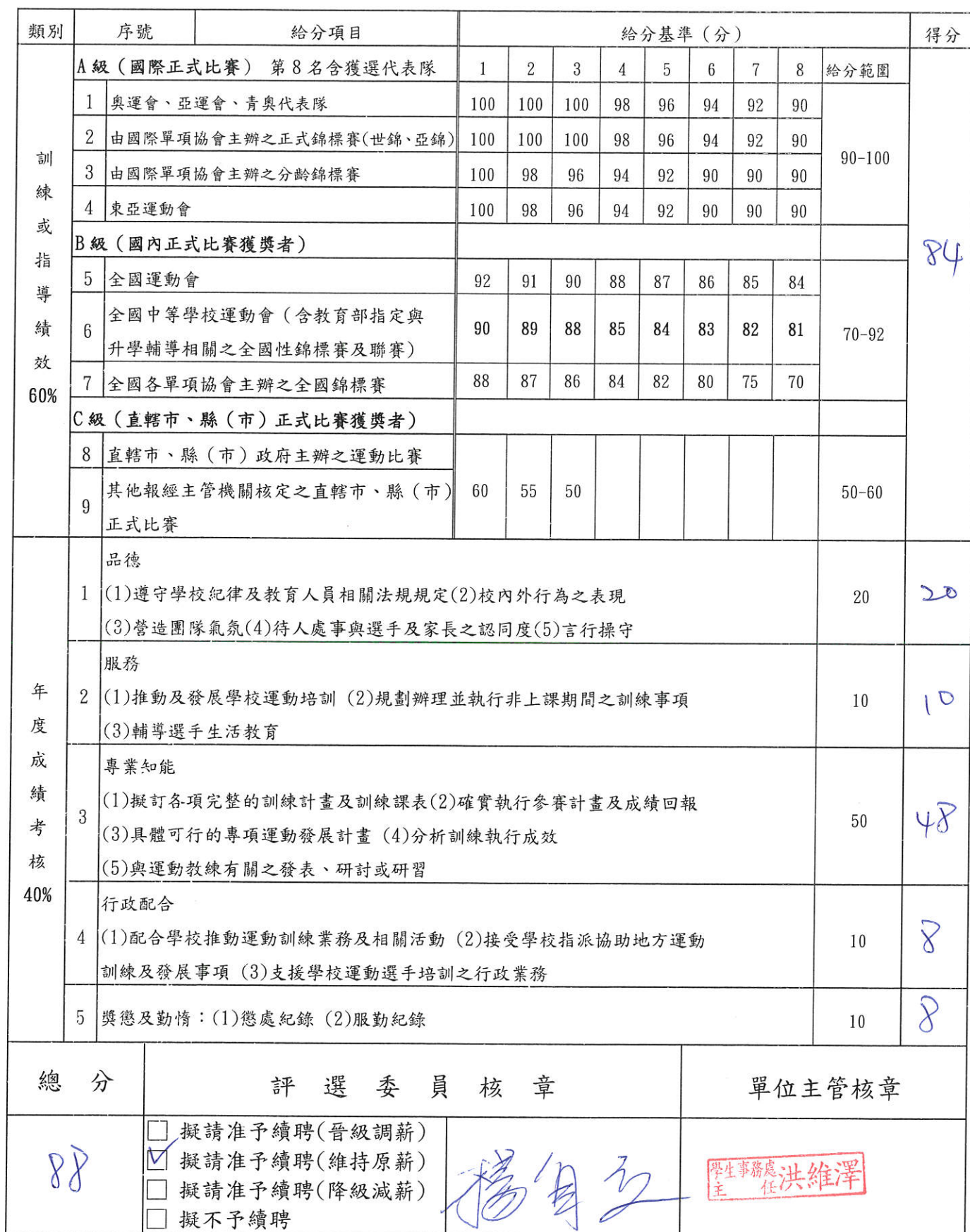
國立臺東專科學校運動教練績效考核表