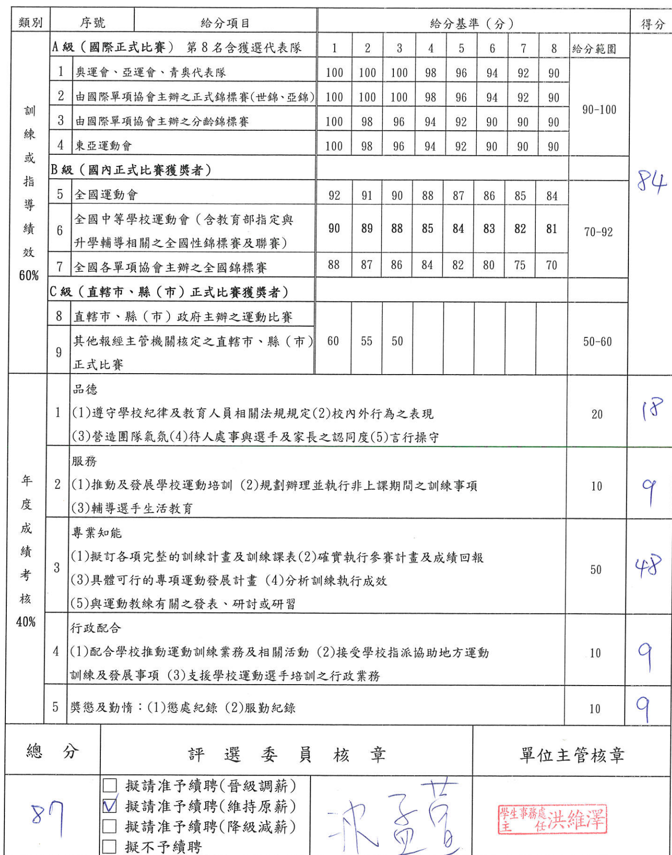
國立臺東專科學校運動教練績效考核表