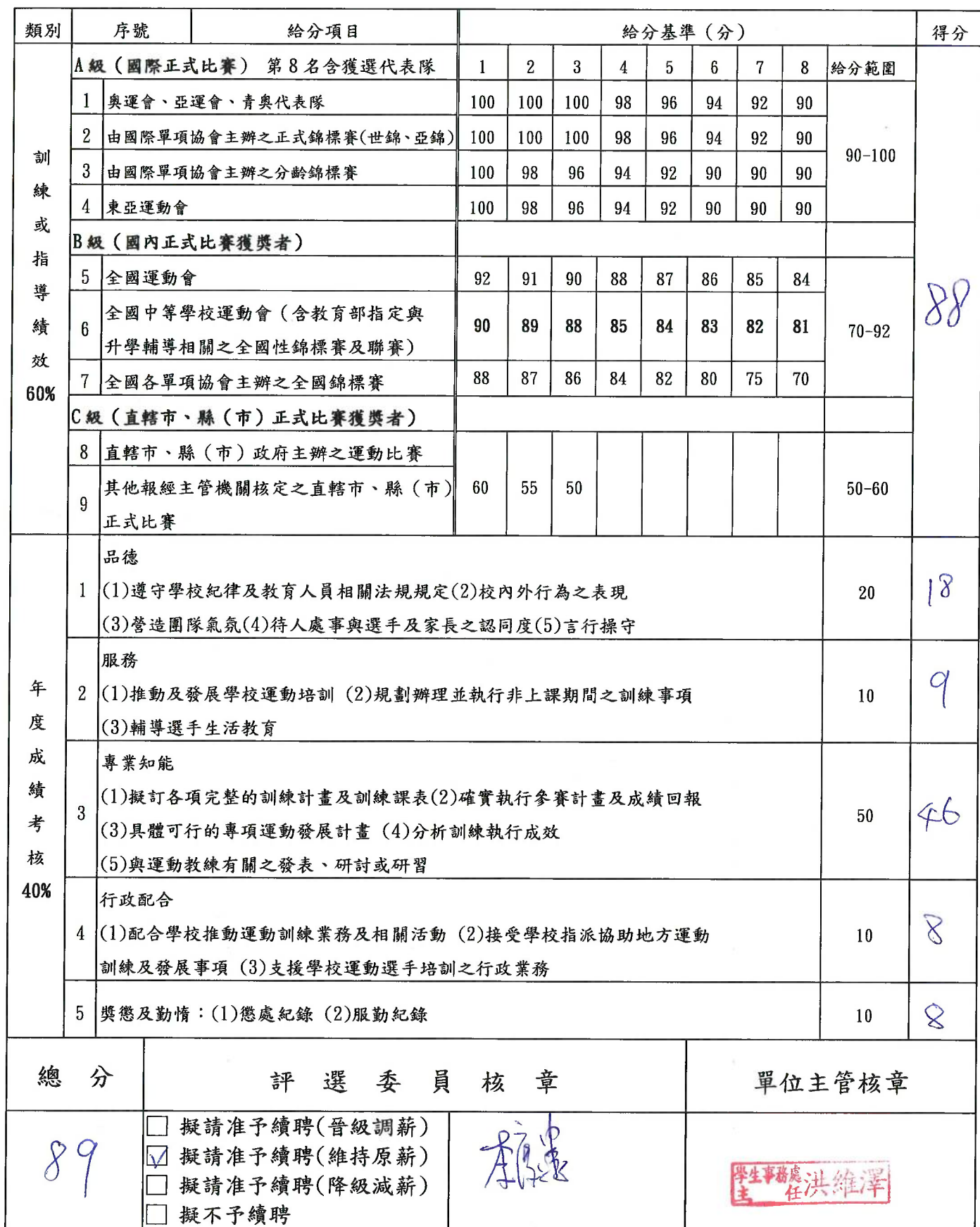
國立臺東專科學校運動教練績效考核表