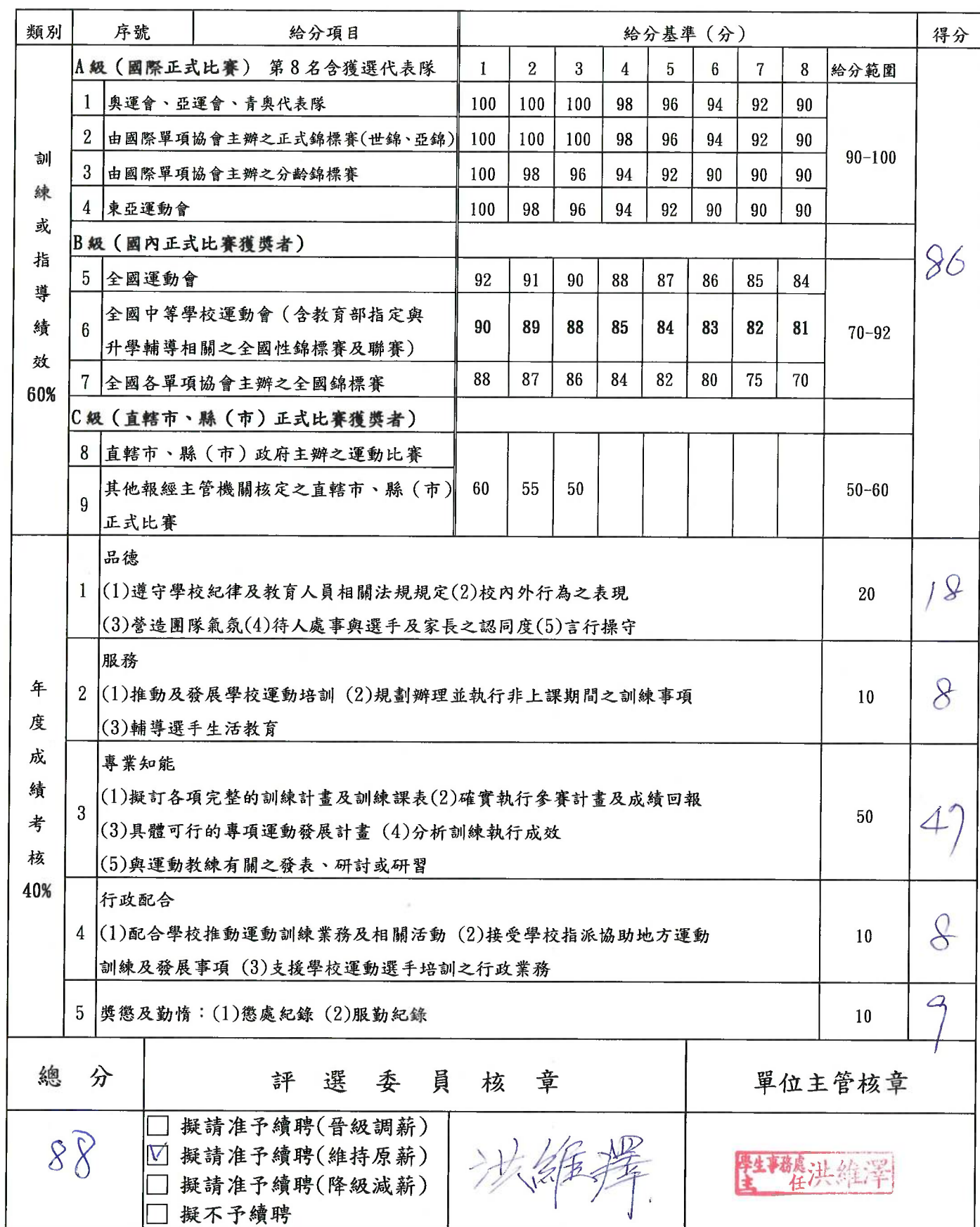
國立臺東專科學校運動教練績效考核表